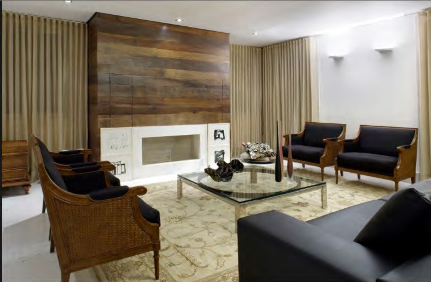
Imagem 19/21: A arquiteta Cristina Menezes atendeu ao desejo dos clientes em ter uma "casa com cara de casa" ao criar espaços mais tradicionais e incluir uma lareira na sala (34,50 m 2 ). O equipamento se fazia necessário, pois a residência está localizada em uma região de clima ameno e exigia aquecimento nos dias mais frios. O modelo a lenha foi construído com peças pré-moldadas e emoldurado por madeira de demolição canela. O mobiliário da Artefacto completa a sala MAIS