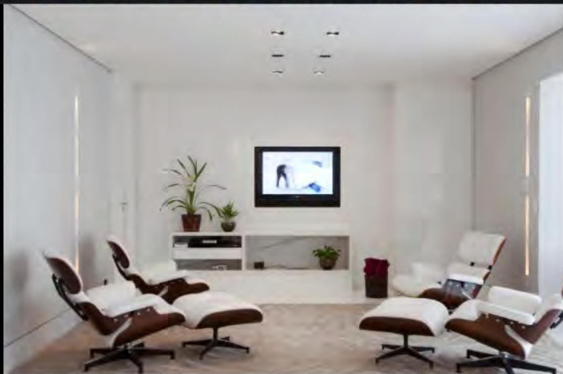
Imagem 5/22: Apenas o tapete da Século, na cor bege, quebra a unidade do branco proposta pela arquiteta Cristina Menezes no home theater. As poltronas Charles Eames, da Tetum, trazem sofisticação e design ao ambiente