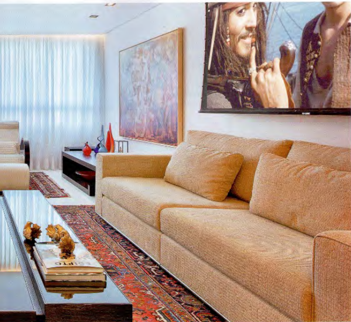
Livings cada vez mais integrados marcam presença nos imóveis atualmente. E aqui não foi diferente. A única intervenção de isolamento é a divisória de madeira, que cria um home theater íntimo para os filhos menores usarem, reservando-lhes um espaço para a bagunça atrás da sala de jantar

as obras de arte valorizam e humanizam os espaços”, ressalta.