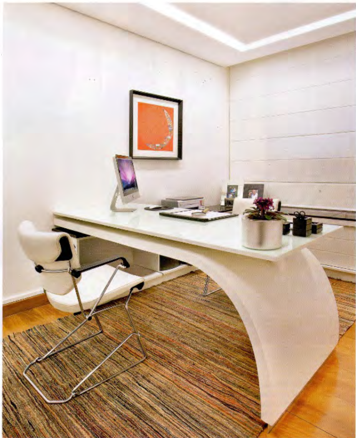
Ter um home office clean era um desejo do empresário que trabalharia nele. A mesa de trabalho com formas ousadas, que é a protagonista deste mobiliário, foi desenhada pelo escritório da arquiteta